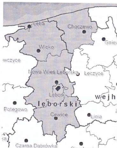
Rysunek 1. Obszar Lokalnej Grupy Działania Dorzecze Łęby

Zasięg oddziaływania poszczególnych EFSI, z których współfinansowana będzie Lokalna Strategia Rozwoju będzie obejmował cały obszar objęty strategią. Rozkład koncentracja środków na obszary poszczególnych gmin objętych strategią będzie uzależniony od aktywności lokalnych społeczności.